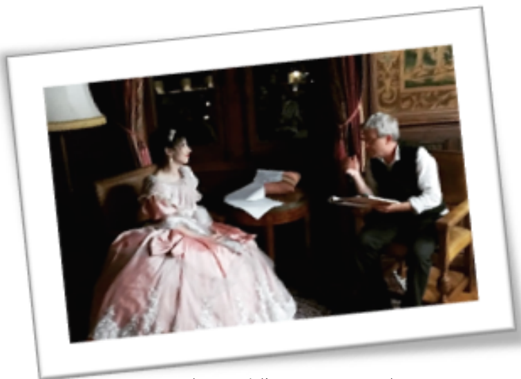
Avec le comédien et conteur Florent GILLES